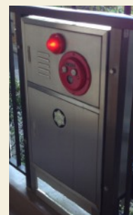
消火器と非常ベルは各階に設置されています。 緊急時には[非常ベル]を押します。