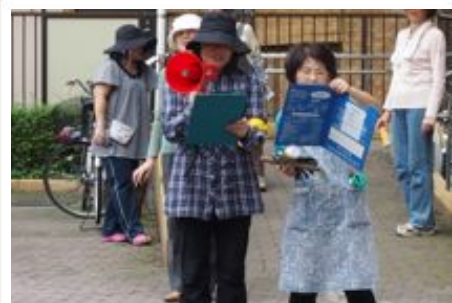
防災対策本部設置の広報(ハンドマイク)

た。災害発生時の対策本部の設置と初動について、より多くの住民に知ってもらう活動がさらに必要です。