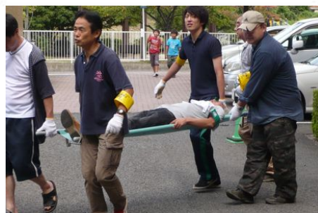
担架による避難訓練

マンションホームページに「防災のページ」があります。今回の訓練の様子やアンケート、まだ少ないですが、各種防災の資料を掲載しています。ぜひ一度ご覧ください。