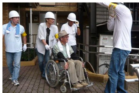
車椅子による避難訓練

た。災害発生時の対策本部の設置と初動について、より多くの住民に知ってもらう活動がさらに必要です。