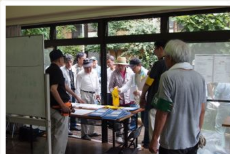
自主防災対策本部